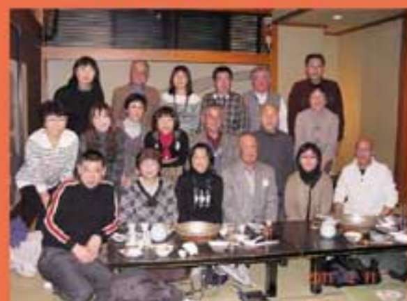
「ちゃんこ巴湯」両国店にて