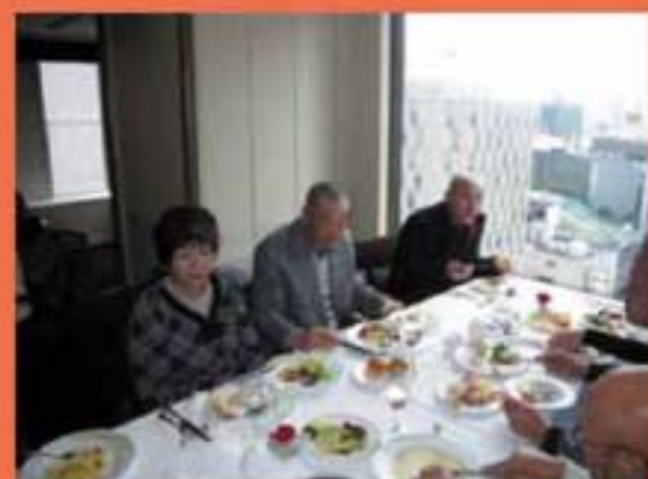
帝国ホテルのランチバイキング