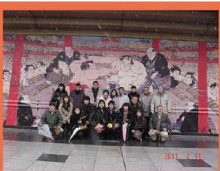
両国国技館前にて

今回の一泊ツアーは美食と見学と皆さん大満足のツアーだったと思います。又、企画をいたしますので、ご参加の程よろしくお願い致します。